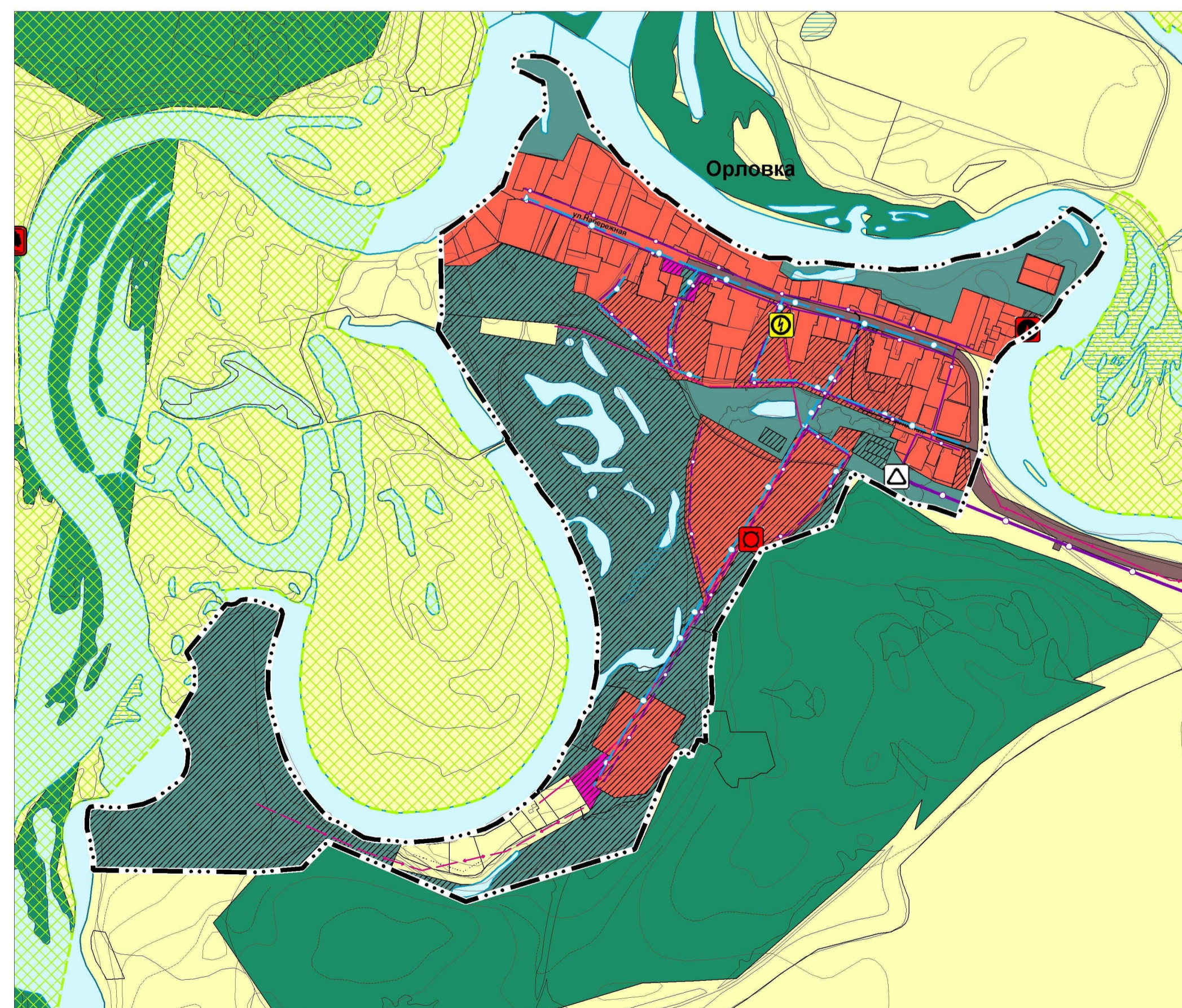
Карта планируемого размещения объектов инженерной инфраструктуры местного значения с. Орловка муниципального района Хворостянский Самарской области