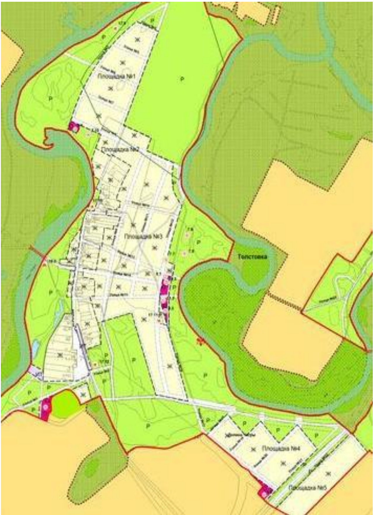
Рис. № 4- Территории под перспективное развитие деревни Толстовка