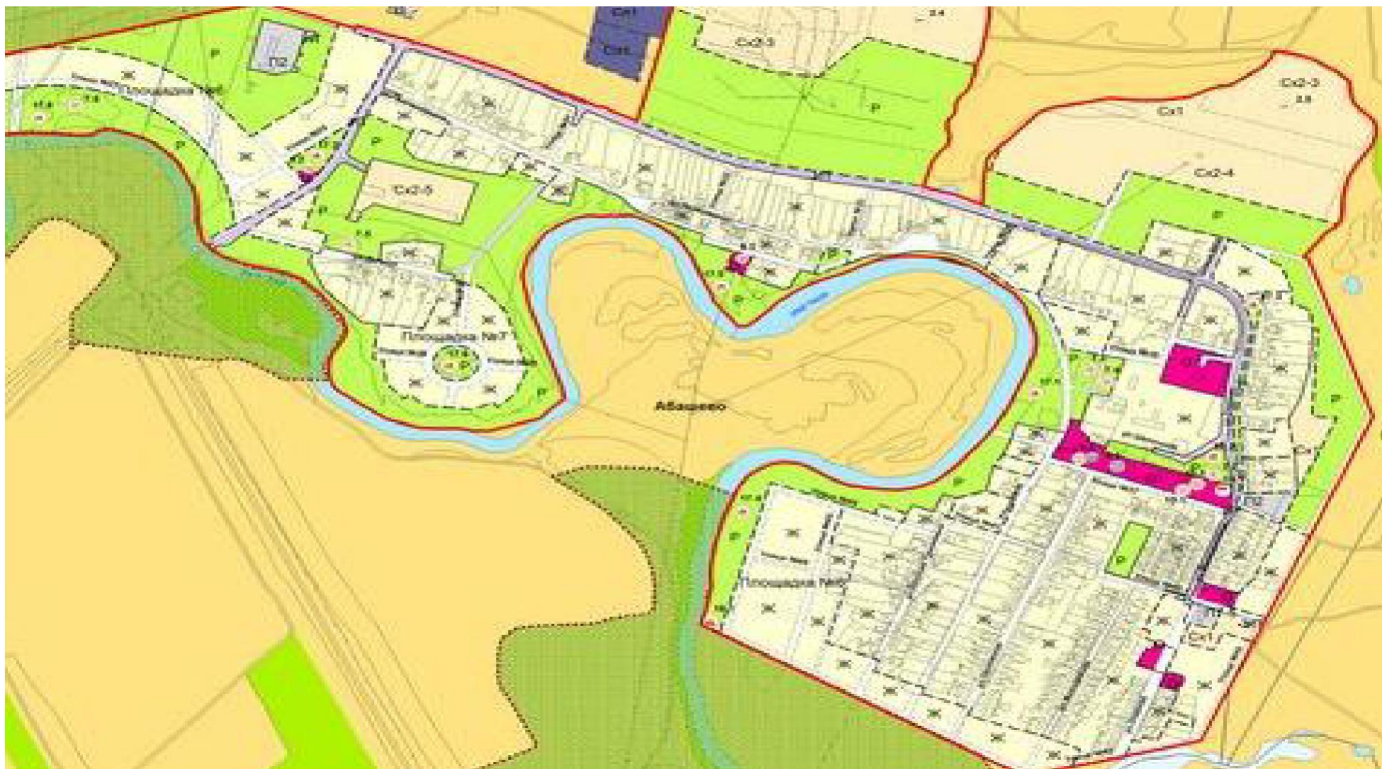
Рис. № 5- Территории под перспективное развитие села Абашево