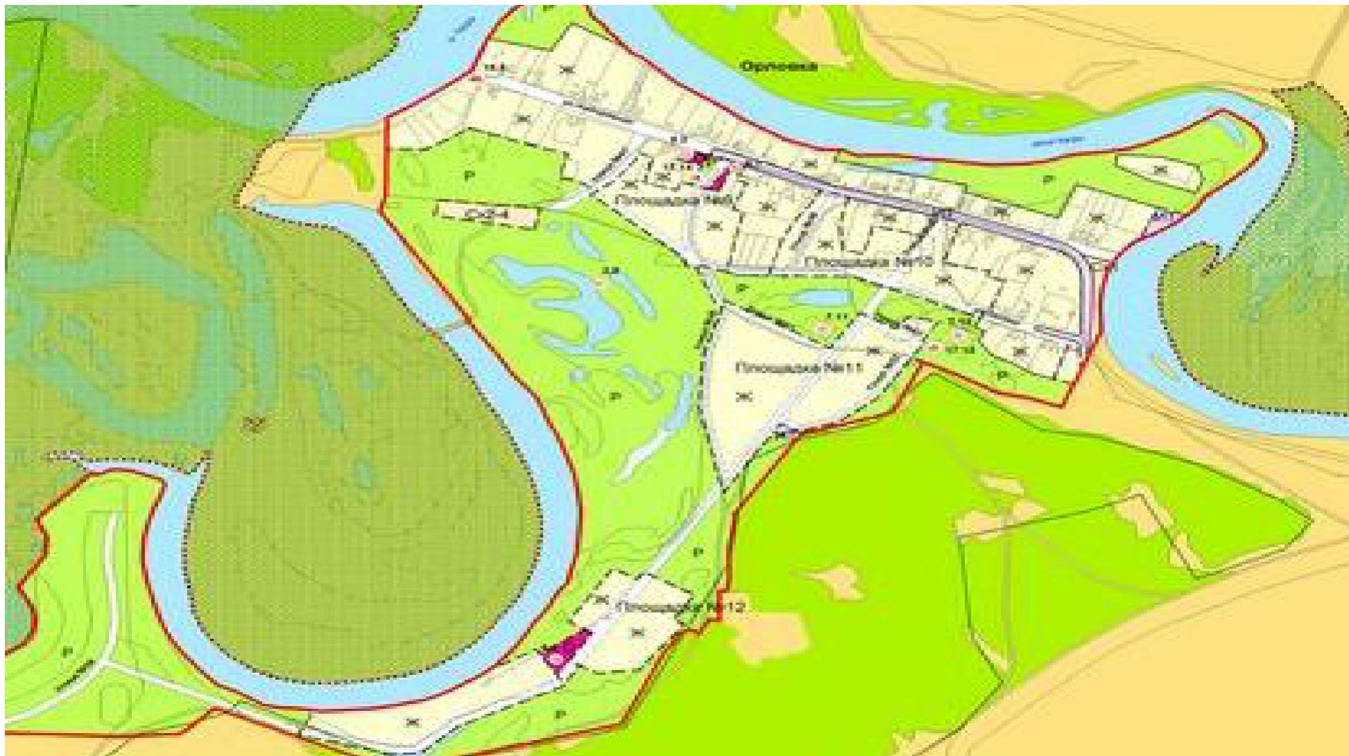
Рис. № 6- Территории под перспективное развитие села Орловка